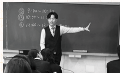
講師が在校生を前に経験を語る様子

る形で、この取り組みに協力しています。趣旨にご賛同いただき、ご関心のある方はぜひ「光陵会事務局」(staff@koryokai.jp)までご連絡ください。光陵会が運営する、卒業生にご職業などの人材情報を登録いただく「光陵卒業生人材バンク」をご案内させていただきます。登録いただいた情報はキャリアガイダンスの講師紹介などに活用いたします。遠方にお住まいで来校が難しい方もオンラインでのご参加が可能です。全国でご活躍の卒業生の皆様、ぜひ、ご協力をよろしくお願ひいたします。