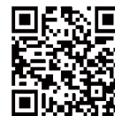
総会・懇親会 出欠フォーム